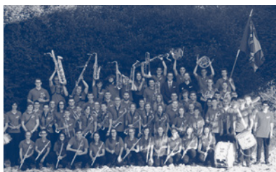
13:30 Uhr Jugendmusik Siebnen