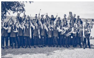
16:00 Uhr Jugend Blasorchester Oberer Sempachersee (JBOS)