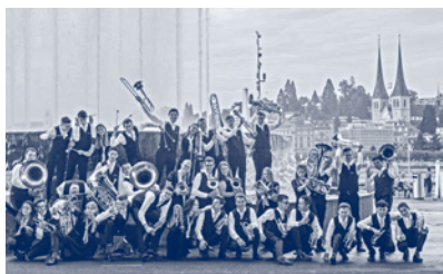
12:00 Uhr BML Talents

ab 12:00 diverse Verpflegungsmöglichkeiten auf dem Europaplatz